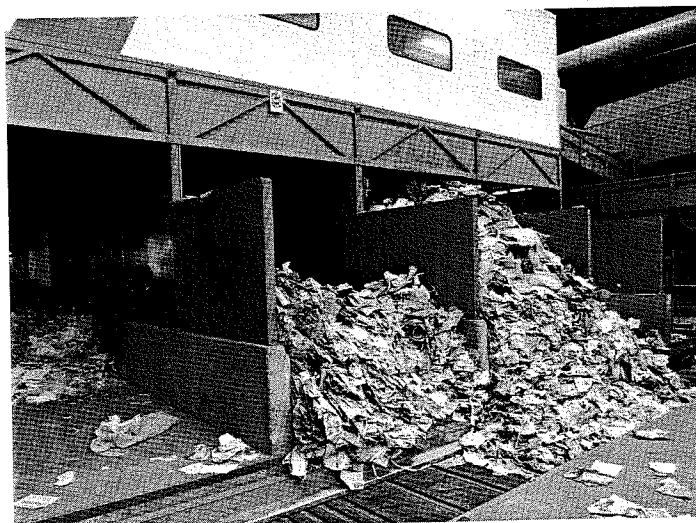
Bij de huisvuilscheidingsinstallatie in Amersfoort wordt huishoudelijk afval op een band gevoerd (foto boven) en gescheiden in verschillende fracties (foto midden). De verschillende deelstromen (foto onder) kunnen weer als grondstof worden ingezet.